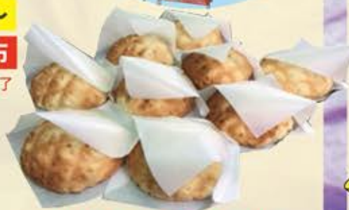
焼きたてメロンパン