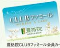
豊格院CLUBファミリー会員カード